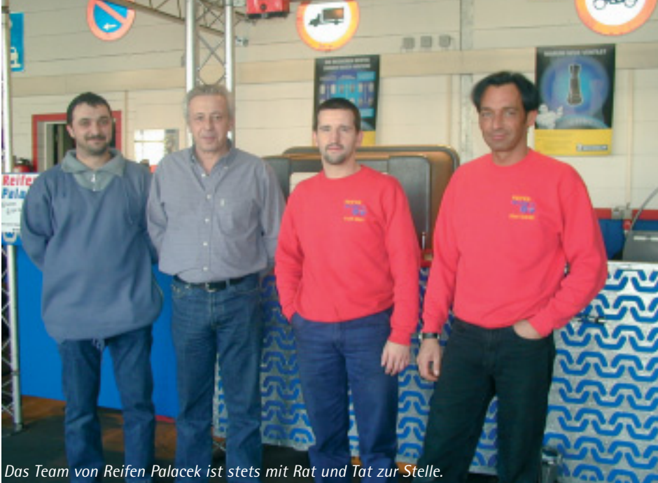
Das Team von Reifen Palacek ist stets mit Rat und Tat zur Stelle.

spruchsvollen Unterhaltungsroman. Die Memoarien von Dieter Bohlen wären allerdings kein Thema für mich.